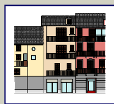
LARGO CLEMENTE PLETTI